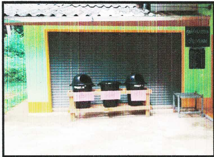
จุดรวมขยะอันตรายของหมู่ที่ ๓ บ้านปลายคลองศอก